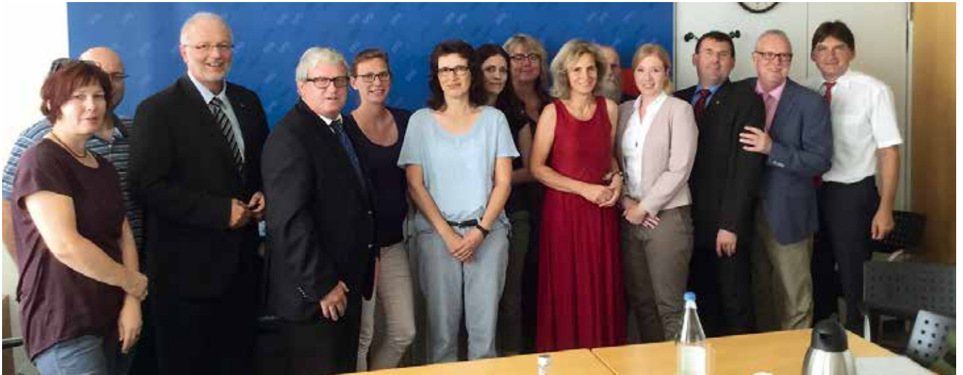
Die Teilnehmer/innen der Gesprächsrunde.