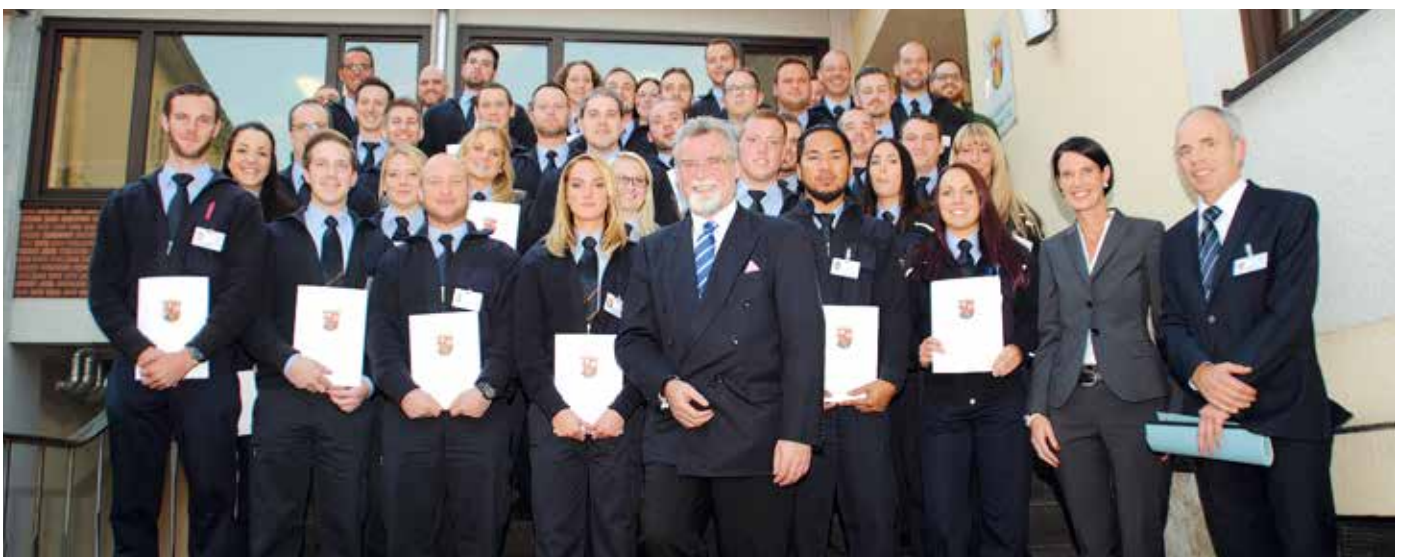
Die „frischgebackenen“ Justizvollzugsbeamten nach bestandener Laufbahnprüfung.

Der BSBD gratuliert allen Kolleginnen und Kollegen herzlich zur bestandenen Laufbahnprüfung. Wir freuen uns sehr!